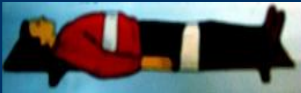
Пример иммобилизации позвоночника