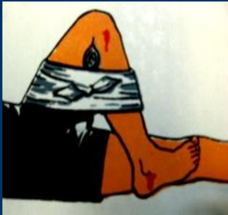
В коленном суставе