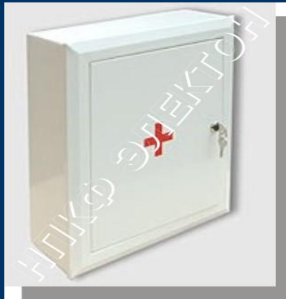
Шкаф для аптечки