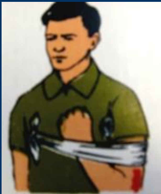
В плечевом суставе