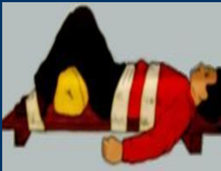
Пример иммобилизации таза