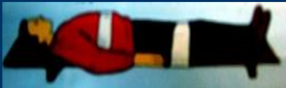
Пример иммобилизации позвоночника