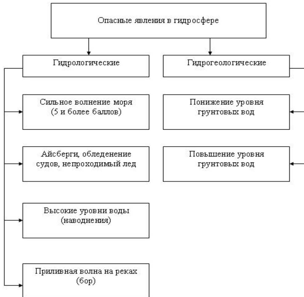
Рис. Виды стихийных бедствий в гидросфере.