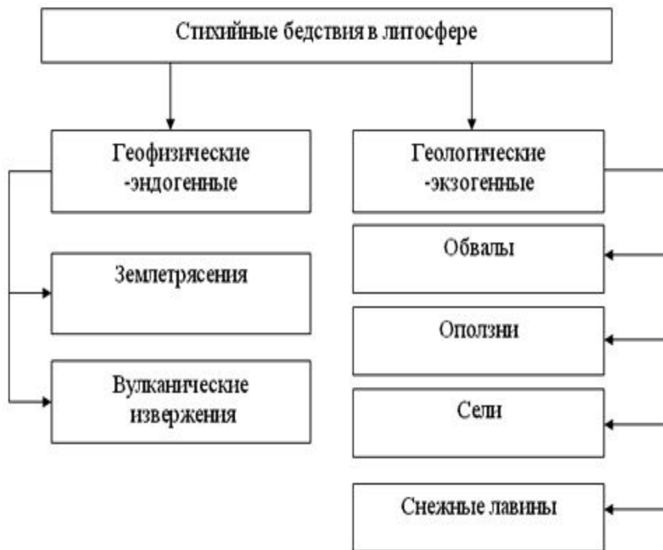
Рис. Стихийные бедствия в литосфере