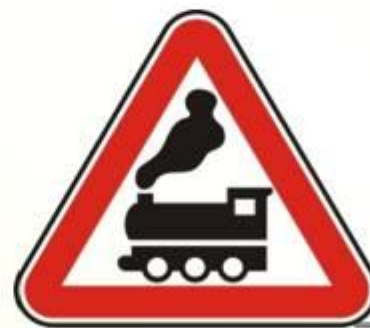
Железнодорожный переезд без шлагбаума