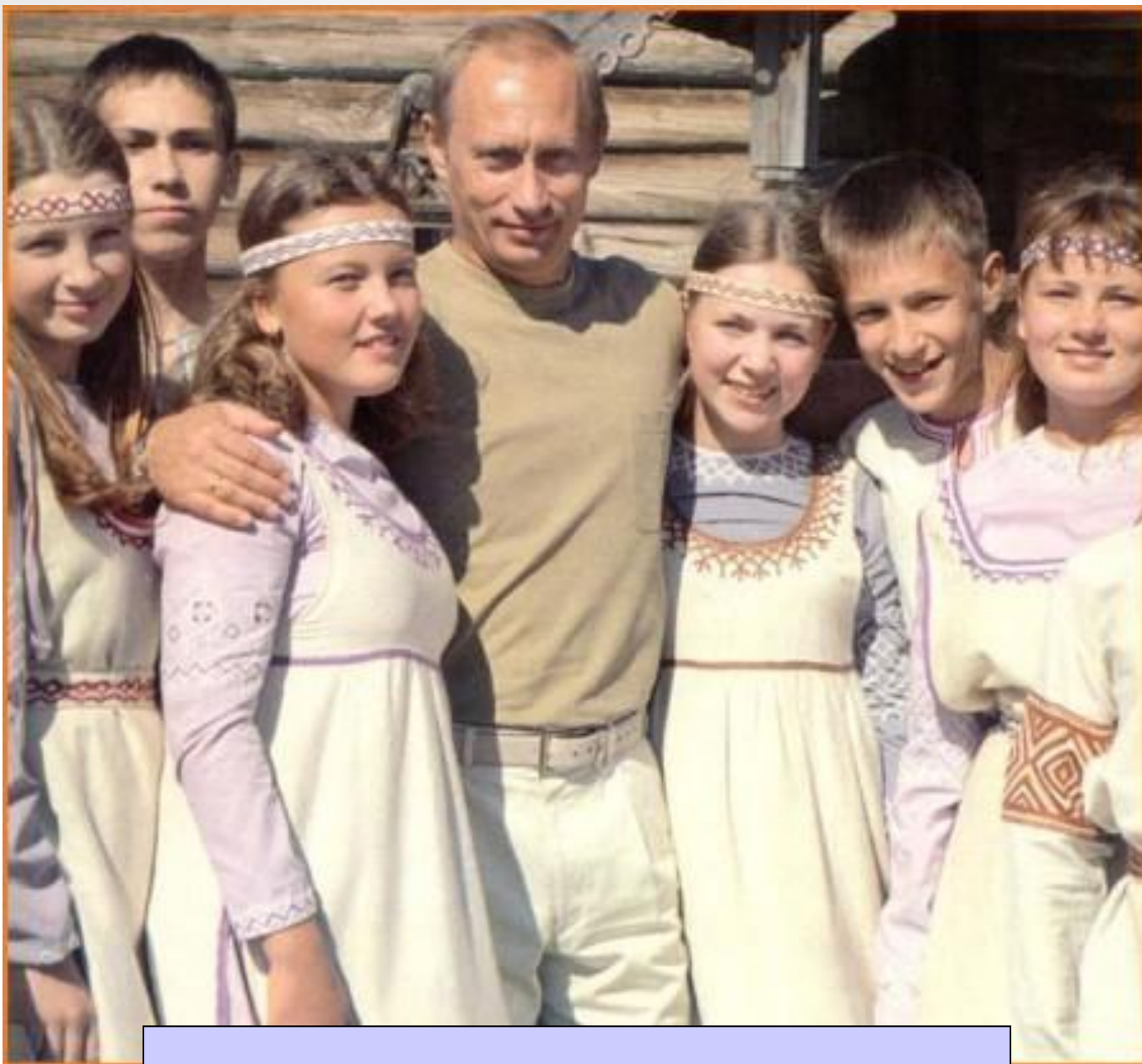
Организация «Дети России»