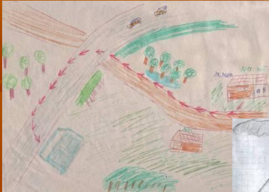
Схема маршрута «Дом – Школа»