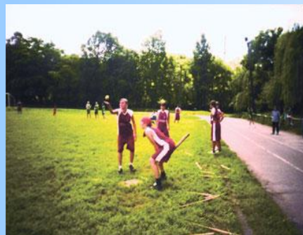
у финнов – песа палло