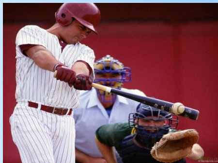
у американцев – бейсбол