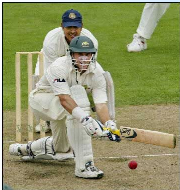
у англичан – крикет