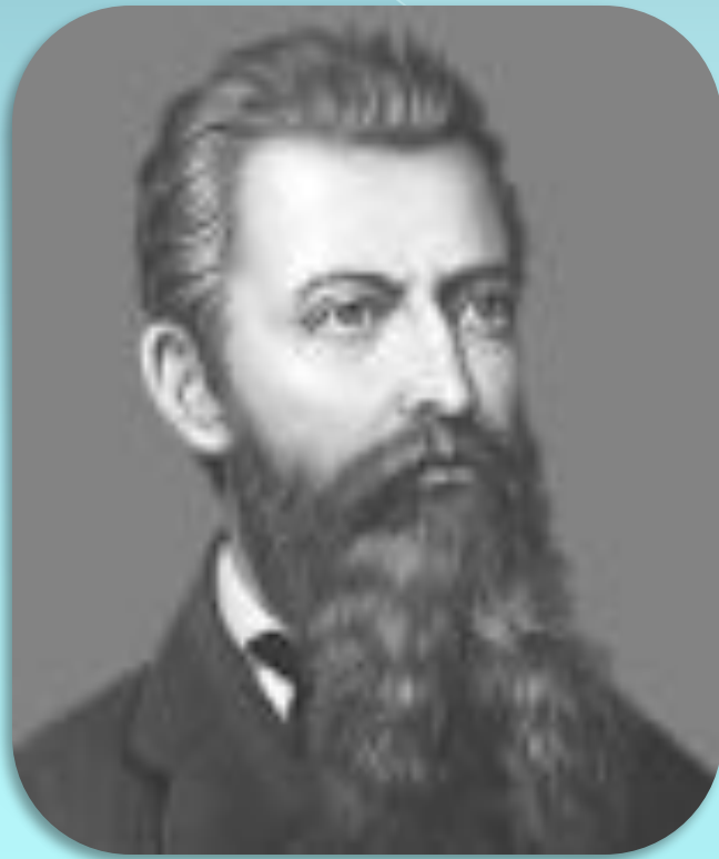
Немецкий философ Людвиг Фейербах

Общение облагораживает и возвышает; в обществе человек невольно, без всякого притворства держит себя иначе, чем в одиночестве.