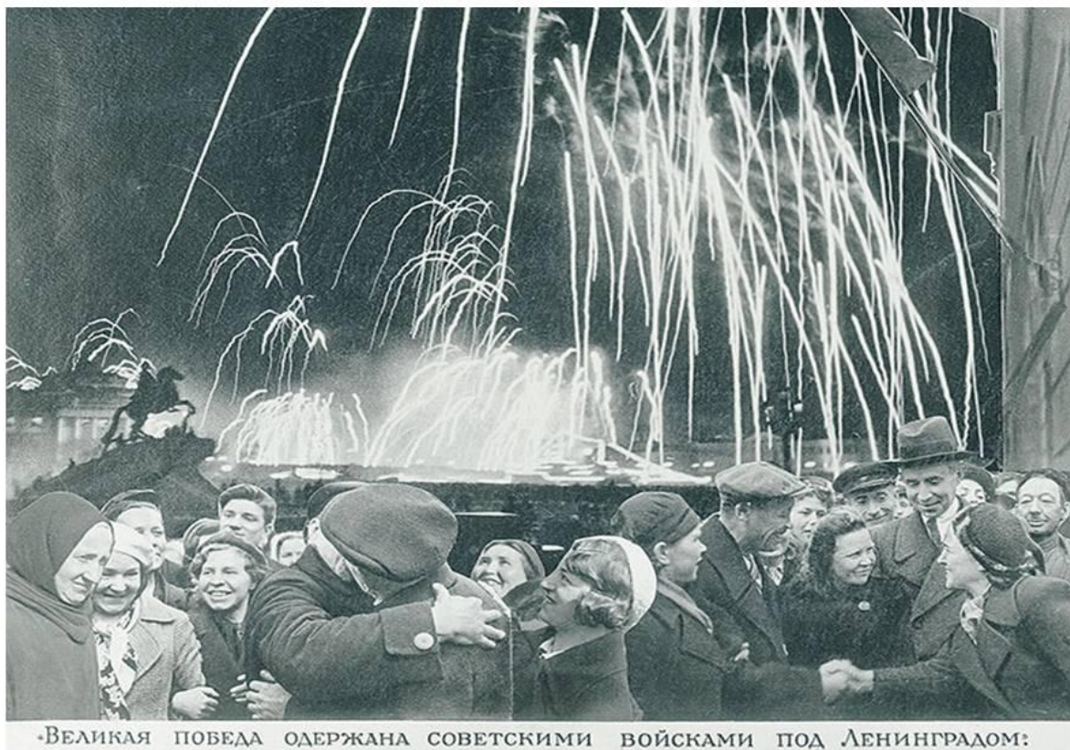
«ВЕЛИКАЯ ПОБЕДА ОДЕРЖАНА СОВЕТСКИМИ ВОЙСКАМИ ПОД ЛЕНИНГРАДОМ:»

18 января 1943 года, со взятием советскими войсками Шлиссельбурга Ленинградская блокада была прорвана. По южному побережью Ладожского озера была проложена железная дорога до станции Поляны, названная впоследствии Дорогой Победы. Блокада Ленинграда длилась 871 день.