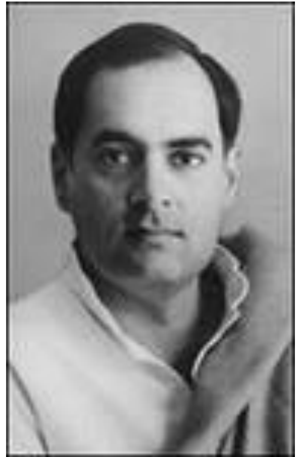
Д. Неру –