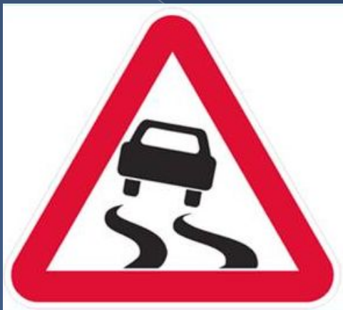
Осторожно, скользкая дорога