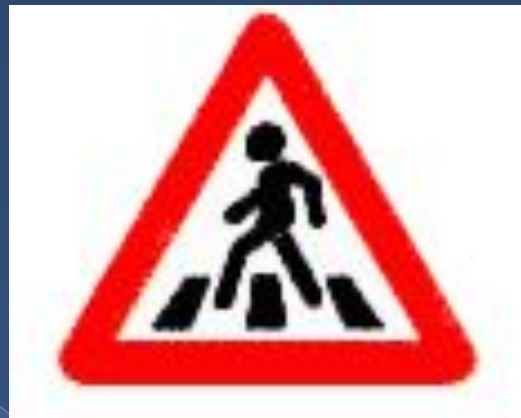
Знак, предупреждающий о наличии пешеходного перехода