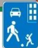
Знак "Жилая зона"