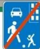
Знак "Конец жилой зоны"