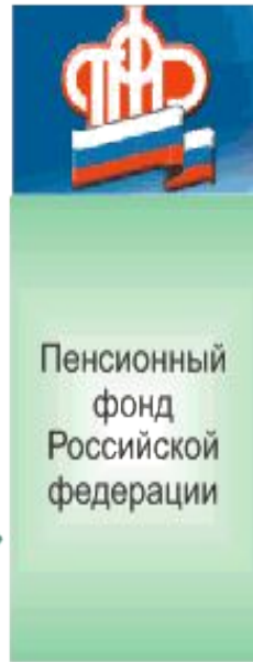
Пенсионный фонд Российской федерации