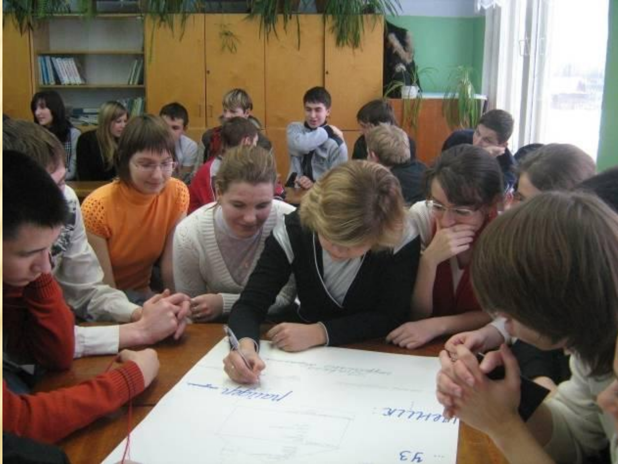
Профориентационная игра «Перспектива успеха» Встреча выпускников разных лет со старшеклассниками МОУ СОШ № 1 г.Окуловка