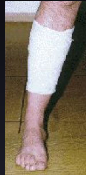
Спиральная повязка на голень, предплечье