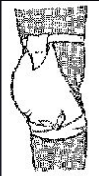
Косыночная повязка ягодичной области