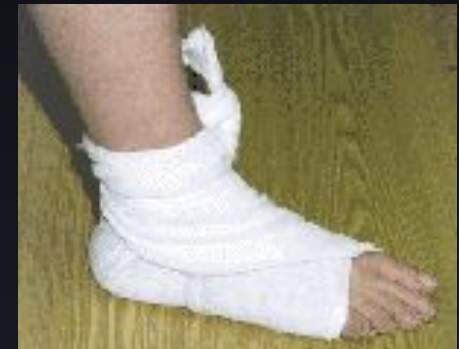
Косыночная повязка на голеностопный сустав и пятку