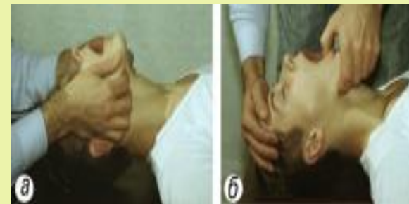
Рис. 2. Подготовка к проведению искусственного дыхания:

Если язык запал – вывернуть тем же пальцем.