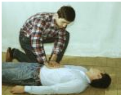
Рис. 8. Освобождение желудка пострадавшего от воздуха путём надавливания на эпигастральную (подложечную) область

При попадании большого количества воздуха не в лёгкие, а в желудок вздутие последнего затруднит спасение больного.