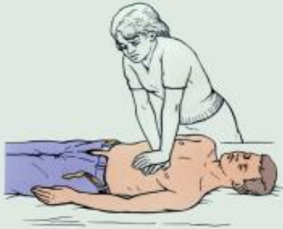
Рис. 6. Положение больного и оказывающего помощь при непрямом массаже сердца.