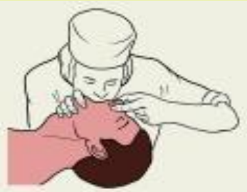
Рис. 3. Искусственная вентиляция лёгких по способу изо рта в рот.