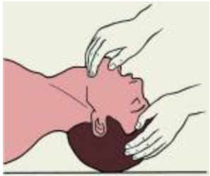
рис.1. Положение головы больного при проведении искусственной вентиляции лёгких по способу изо рта в рот или изо рта в нос.

а) в выдыхаемом воздухе "донора" содержание кислорода достигает 17%, достаточного для усвоения лёгкими пострадавшего;