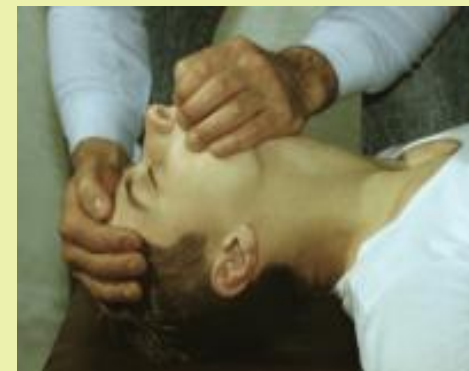
Рис. 4. Искусственная вентиляция лёгких по способу изо рта в нос.

При этом, по возможности синхронизируют ритм вдохов с восстанавливающимся дыханием у пострадавшего.