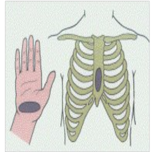
Рис. 3.5. Место соприкосновения руки и грудины при непрямом массаже сердца.

Признаки внезапной остановки сердца - резкая бледность, потеря сознания, исчезновение пульса на сонных артериях, прекращение дыхания или появление редких, судорожных вдохов, расширение зрачков.