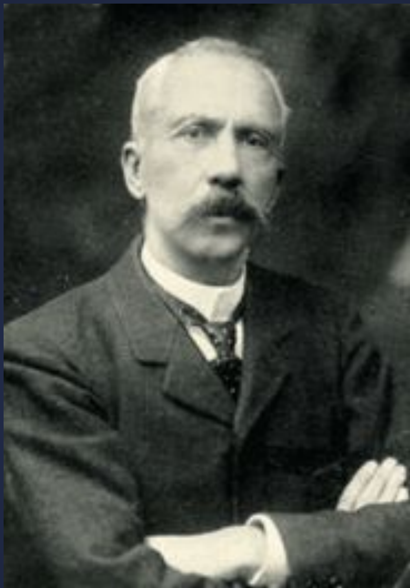
Шарль Робер Рише

В 1902 г. Ш. Рише и Ж. Портье описали анафилактический шок, развившийся при повторной инъекции собакам экстрактов из щупалец морских актиний. Введенный ими термин «анафилаксия» переводится как «противозащита».