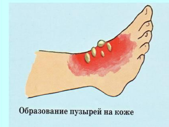
Образование пузырей на коже