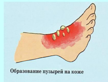
Образование пузырей на коже