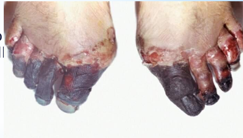
крайне тяжелую (IV)

Обморожение IV степени возникает при длительном воздействии холода, снижение температуры в тканях при нём наибольшее. Оно нередко сочетается с обморожением III и даже II степени. Омертвевают все слои мягких тканей, нередко поражаются кости и суставы. Повреждённый участок конечности резко синюшный, иногда с мраморной расцветкой. Отёк развивается сразу после согревания и быстро увеличивается. Температура кожи значительно ниже, чем на окружающих участках обморожения тканей. Пузыри развиваются в менее обмороженных участках, где имеется обморожение III - II степени. Отсутствие пузырей при развившемся значительном отёке, утрата чувствительности свидетельствуют об обморожении IV степени. может развиваться гангрена. Последствия подобного обморожения необратимы, и в таких случаях пациентам ампутируют поврежденные конечности.