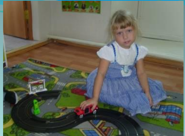
Мы любим играть в игру «Автомобиль»