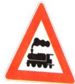
Железнодорожный переезд (без шлагбаума)