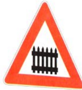
Железнодорожный переезд (с шлагбаумом)