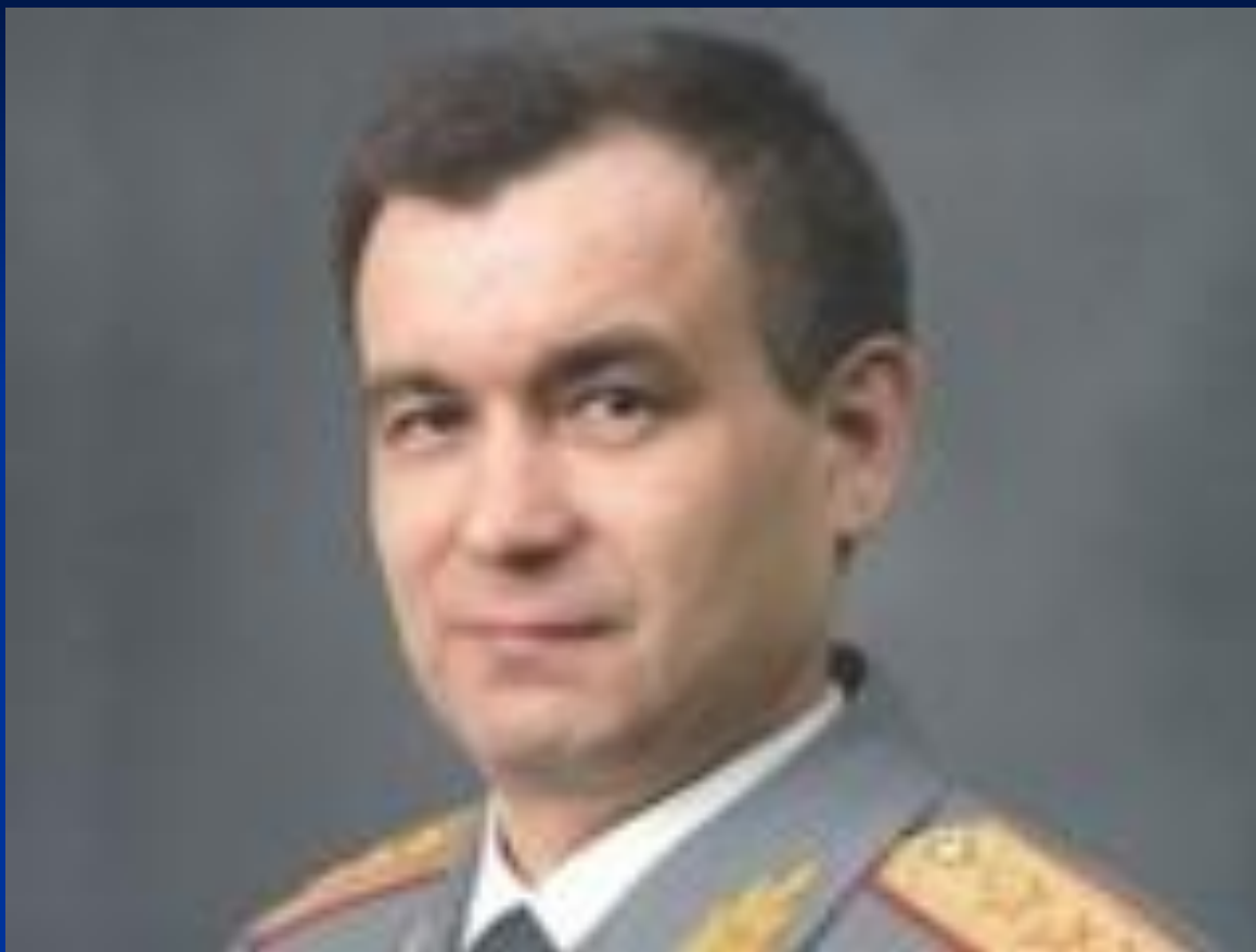
Рашид Нурғалиев - министр внутренних дел России.