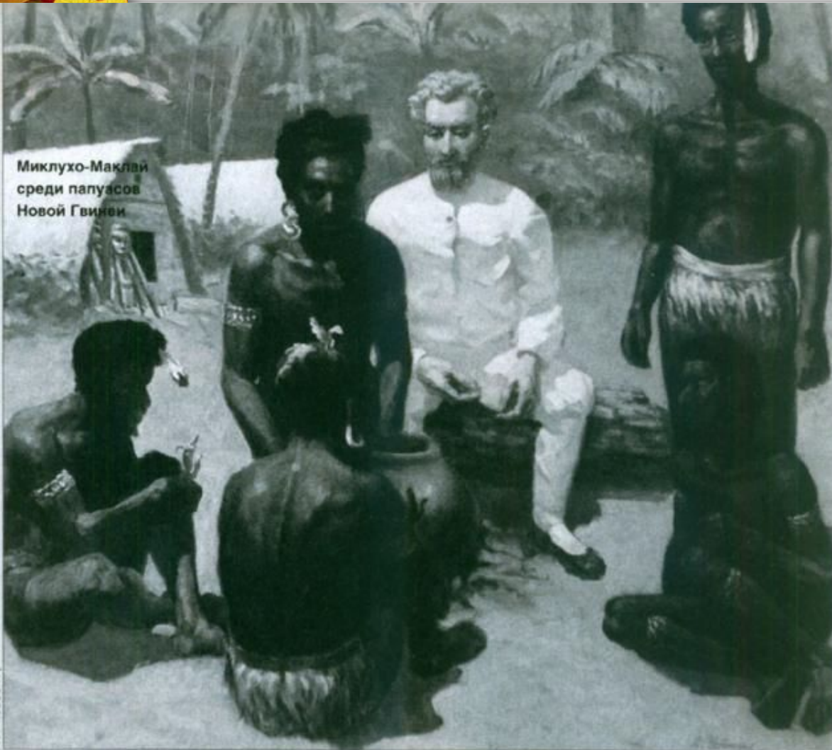
Миклухо-Маклай среди папуасов Новой Гвинеи