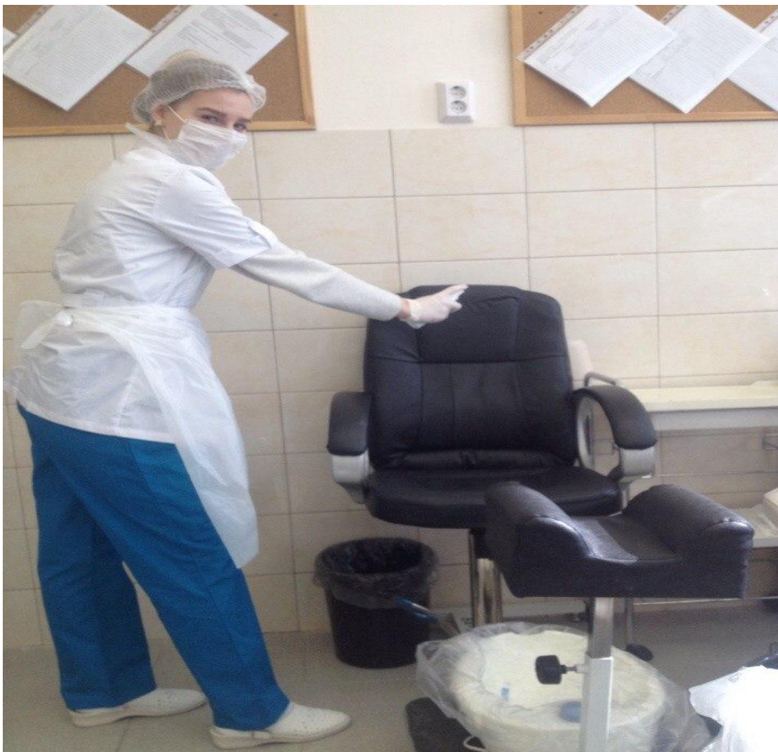
а) Кресло клиента