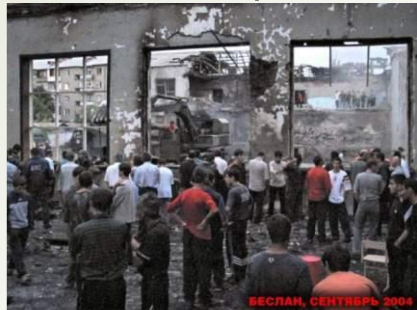
1 сентября 2004 г., Beslan