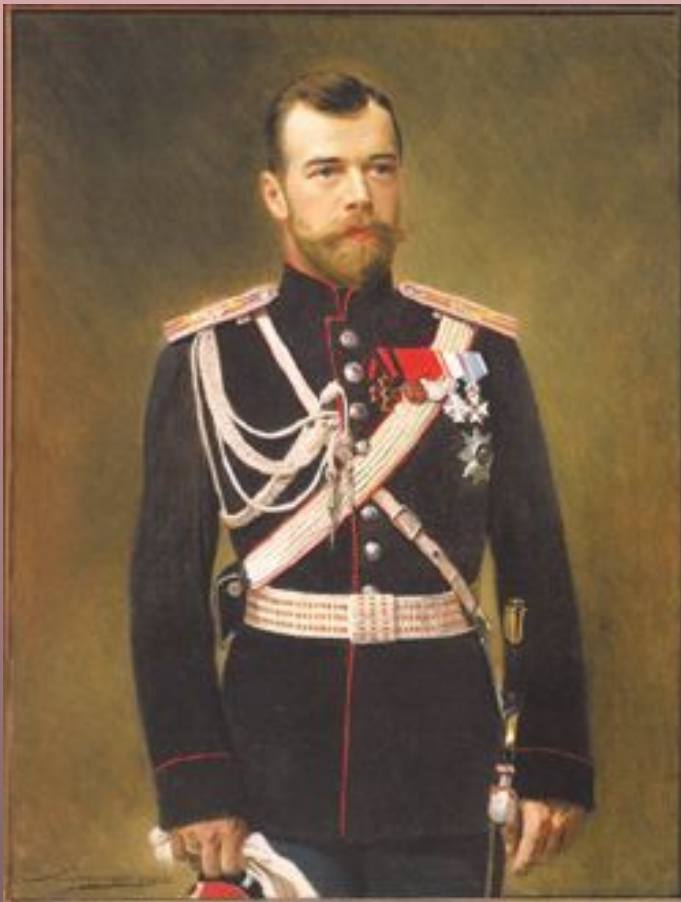
Дмитрий Анатольевич Медведев