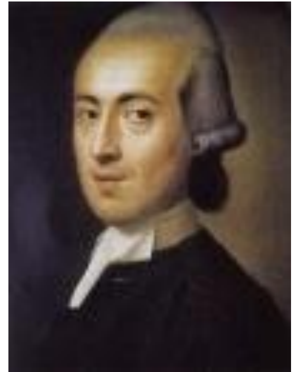
ИОГАНН ГЕРДЕР 25.08.1744 – 00.00.1803

Термин «политическая культура» впервые появился лишь в XVIII в. в трудах немецкого философа-просветителя Иоганна Гердера. . Теория же, предполагавшая изучение мира политики через призму этого концепта, сформировалась еще позднее -только в конце 50-60-х гг. XX в. и получила развитие в работе американского политолога Германа Файнера «Системы правления великих европейских государств» 1956 г. Позднее была опубликована книга американских авторов Г. Алмонда и С. Вербы «Гражданская культура» (1963 г.).