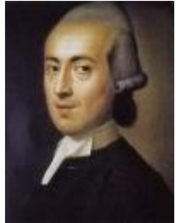
ИОГАНН ГЕРДЕР 25.08.1744 – 00.00.1803

Термин «политическая культура» впервые появился лишь в XVIII в. в трудах немецкого философа-просветителя Иоганна Гердера. . Теория же, предполагавшая изучение мира политики через призму этого концепта, сформировалась еще позднее -только в конце 50-60-х гг. XX в. и получила развитие в работе американского политолога Германа Файнера «Системы правления великих европейских государств» 1956 г. Позднее была опубликована книга американских авторов Г. Алмонда и С. Вербы «Гражданская культура» (1963 г.).