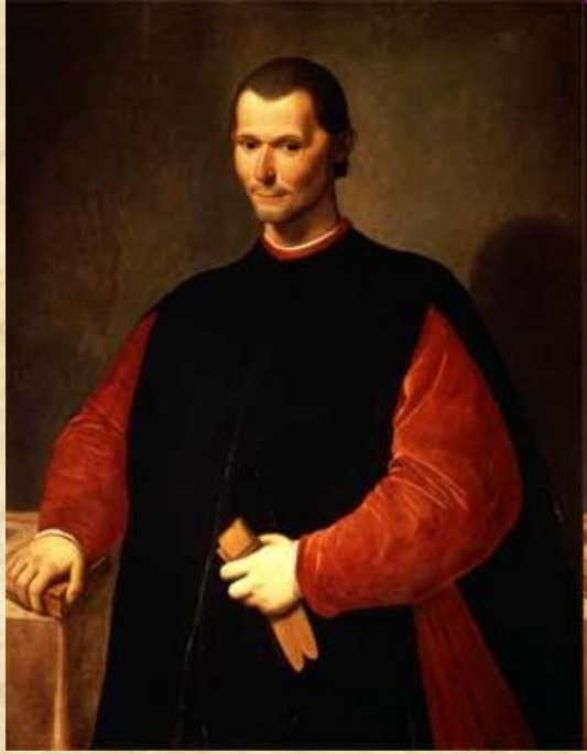
Никколо Макиавелли, XV в.

1. « Государи, когда дело идёт о единстве их подданных, не должны бояться прослыть жестокими.»