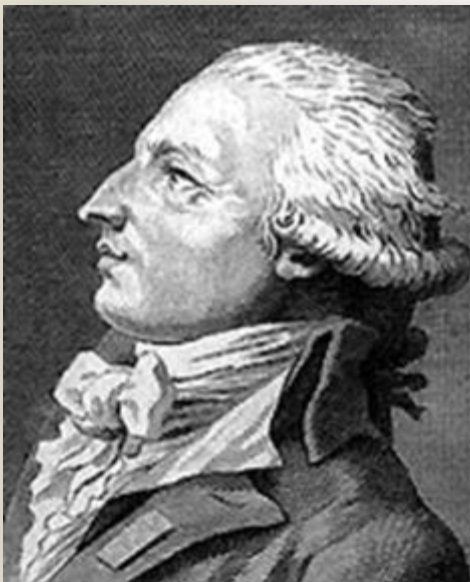
Дестют де Траси 1754-1836

Идеология – (от греч. Idea – идея, образ и logos – слово, понятие) – совокупность политико-правовых и нравственно-философских взглядов на общественно-историческую действительность