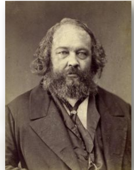
Михаил Бакунин 1814-1876