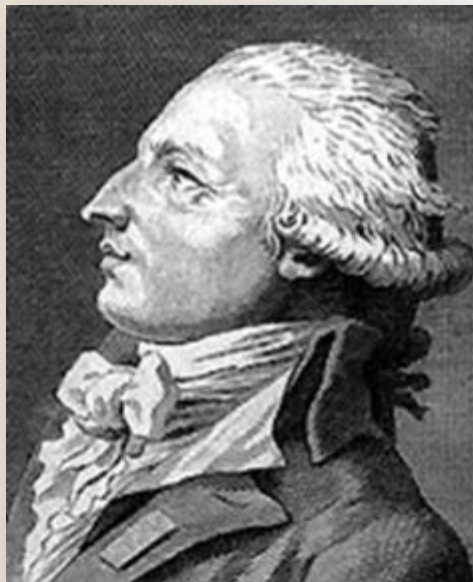
Дестют де Траси 1754-1836

Идеология – (от греч. Idea – идея, образ и logos – слово, понятие) – совокупность политико-правовых и нравственно-философских взглядов на общественно-историческую действительность