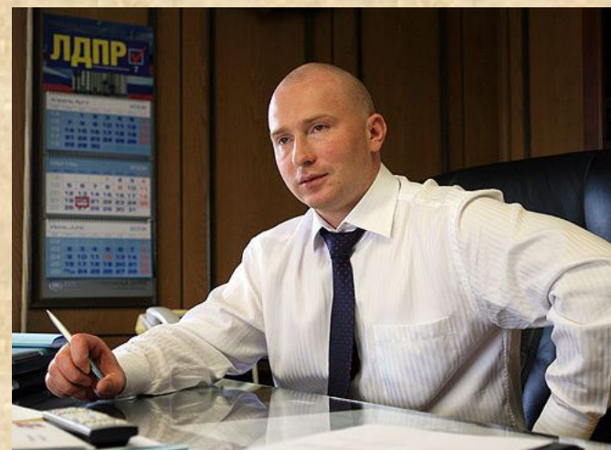
Руководитель Высшего Совета- Лебедев Игорь Владимирович