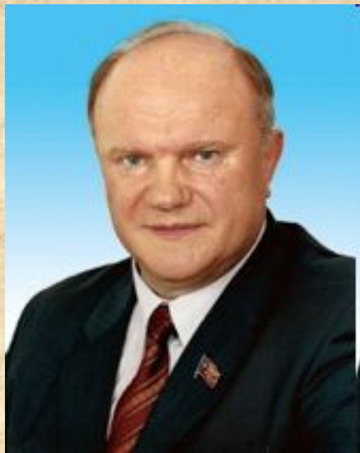
Председатель – ЗЮГАНОВ Геннадий Андреевич.