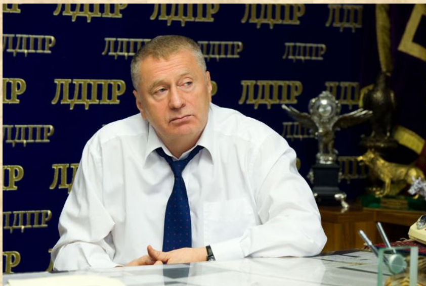
Председатель - ЖИРИНОВСКИЙ Владимир Вольфович.