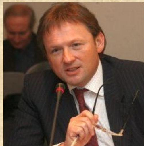
Титов Борис Юрьевич