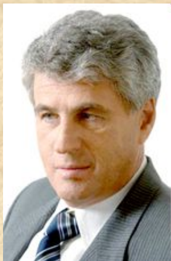
Гозман Леонид Яковлевич