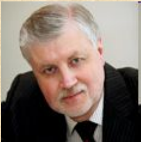
Миронов Сергей Михайлович