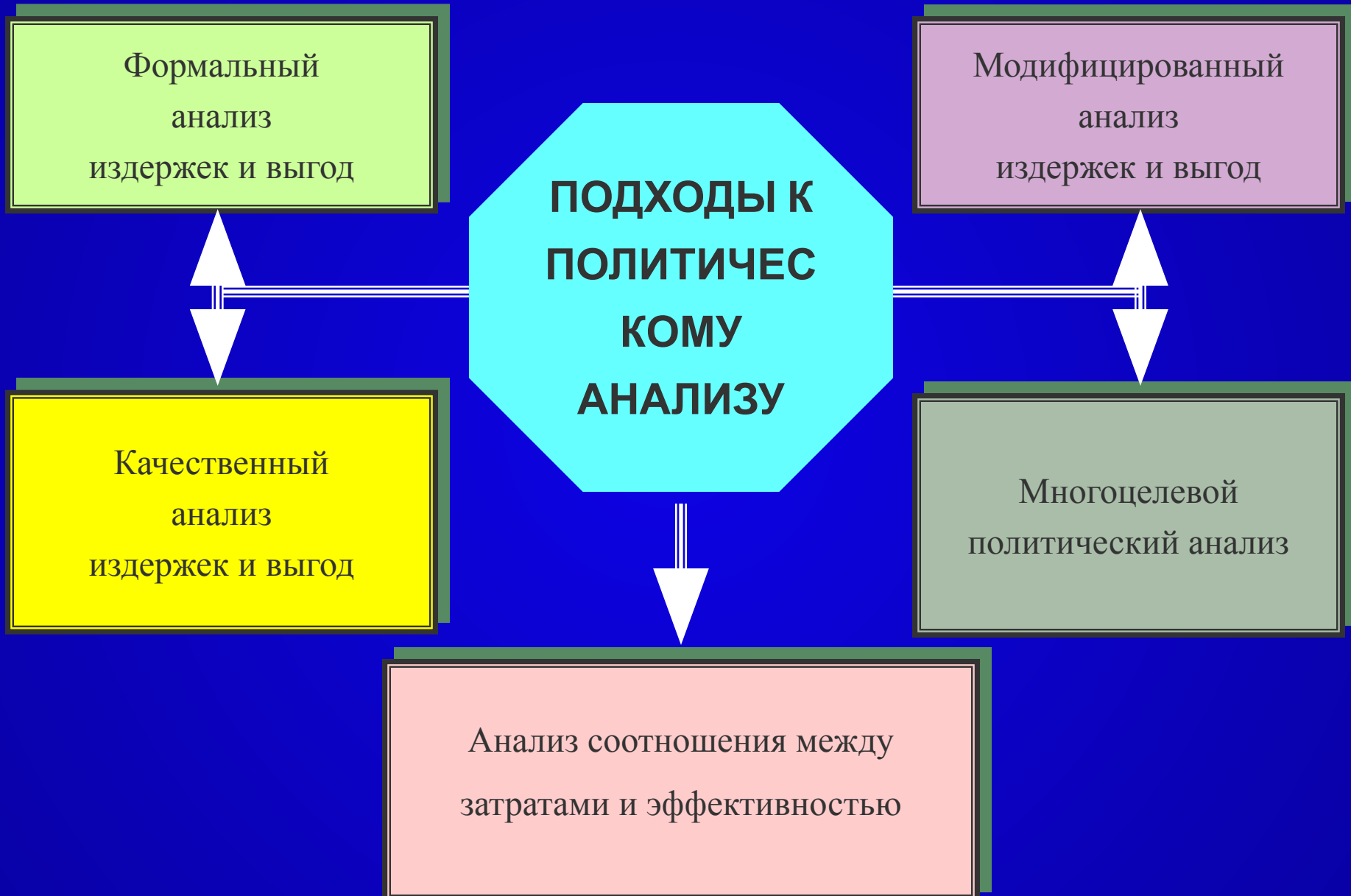
Сх. 87. Подходы к политическому анализу.