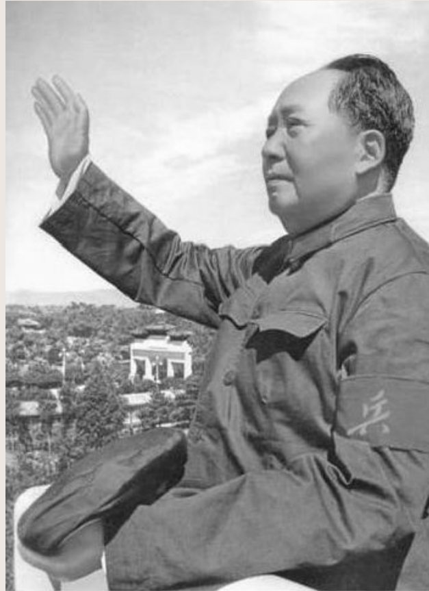
Мао Цзэдун (Китай)