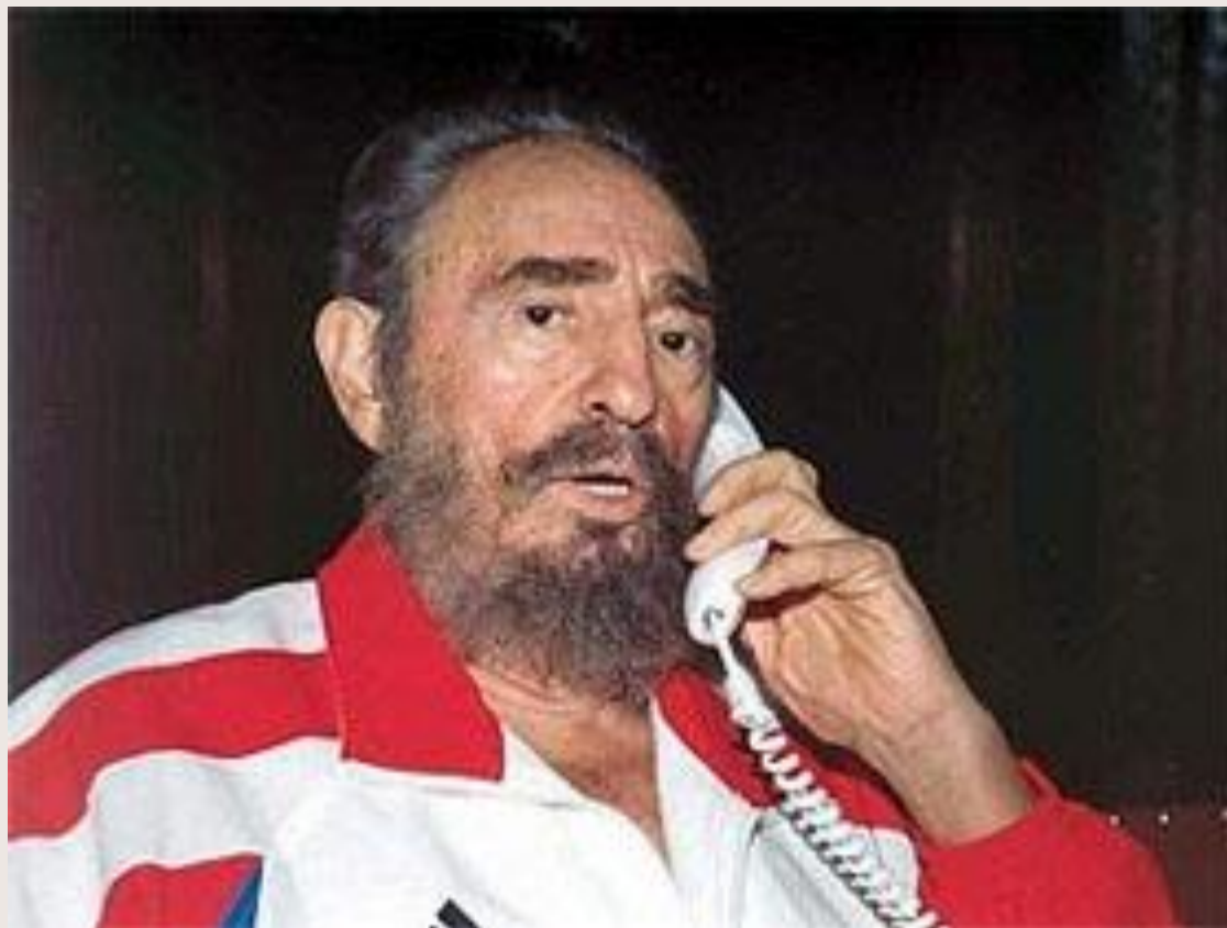
Фидель Кастро (Куба)