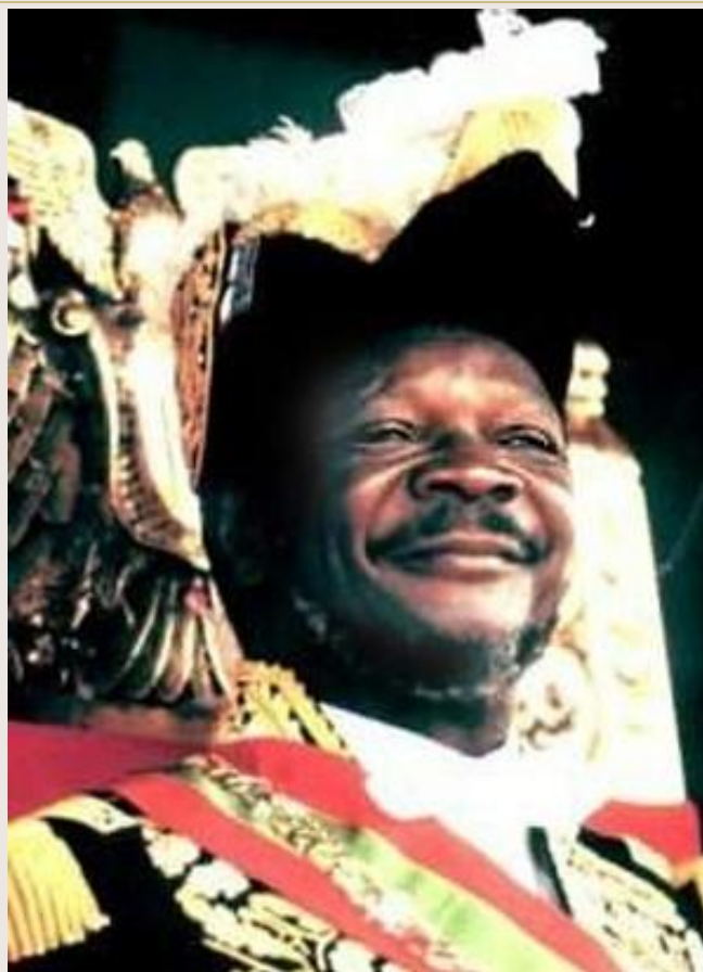
Жан Бедель Бокасса (Центрально-Африканская Империя)