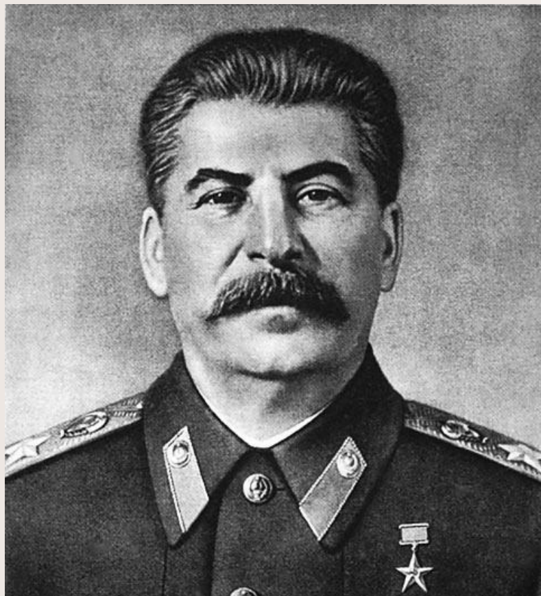
Иосиф Сталин (СССР)