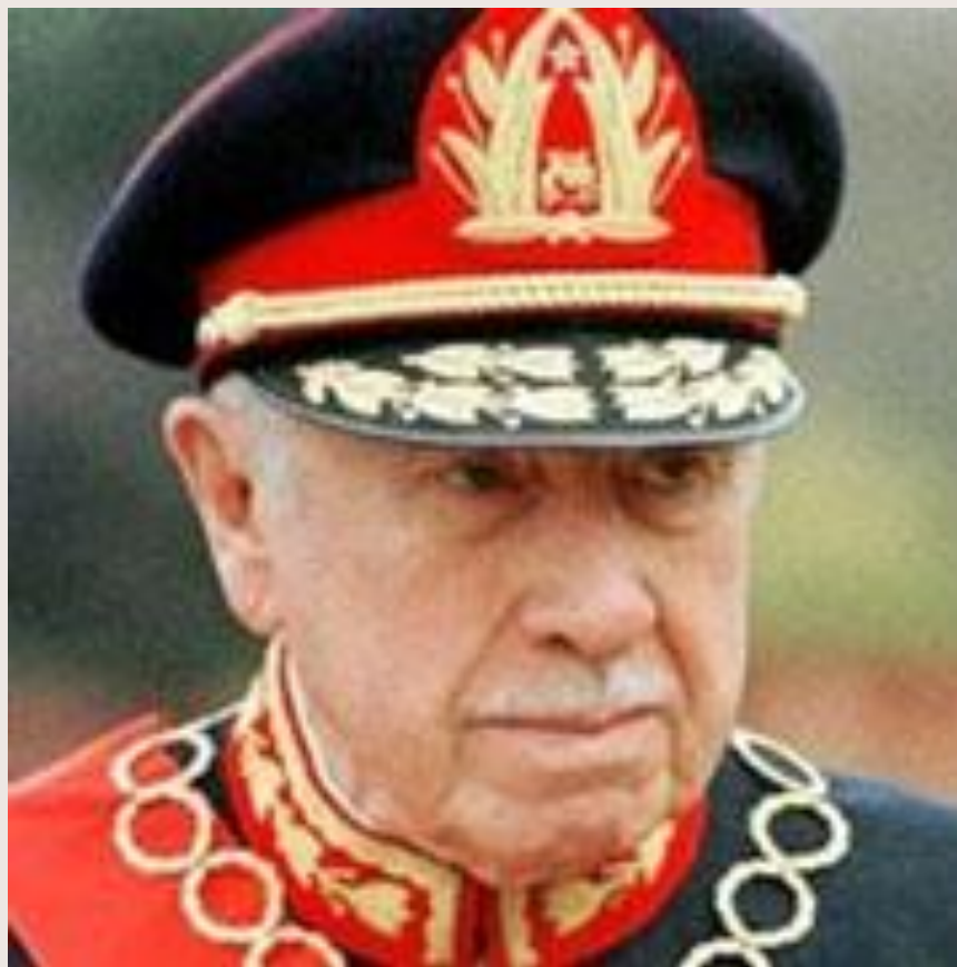
Аугусто Пиночет (Чили)