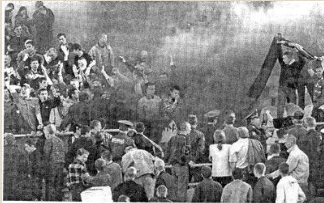
Экспрессивная толпа, превращающаяся в агрессивную.