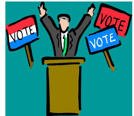
Участие в политической партии