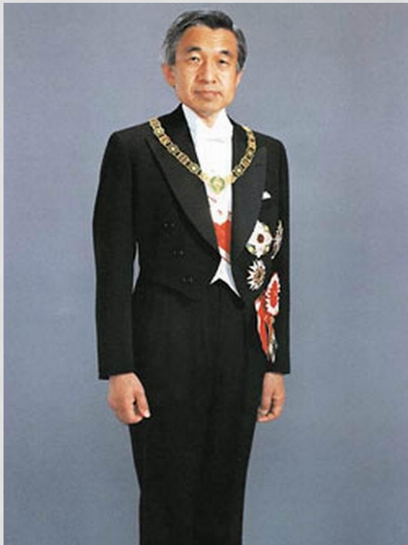
Прем'єр-міністр Нода Йосіхіко