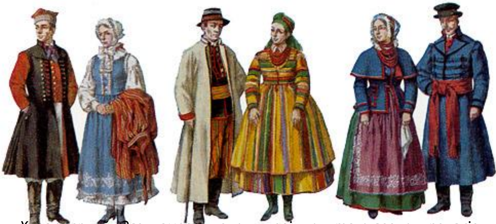
Характерний одяг шамотульських, ловіцьких та куявських поляків