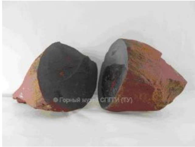
Вулканическая крученая бомба (в разрезе).