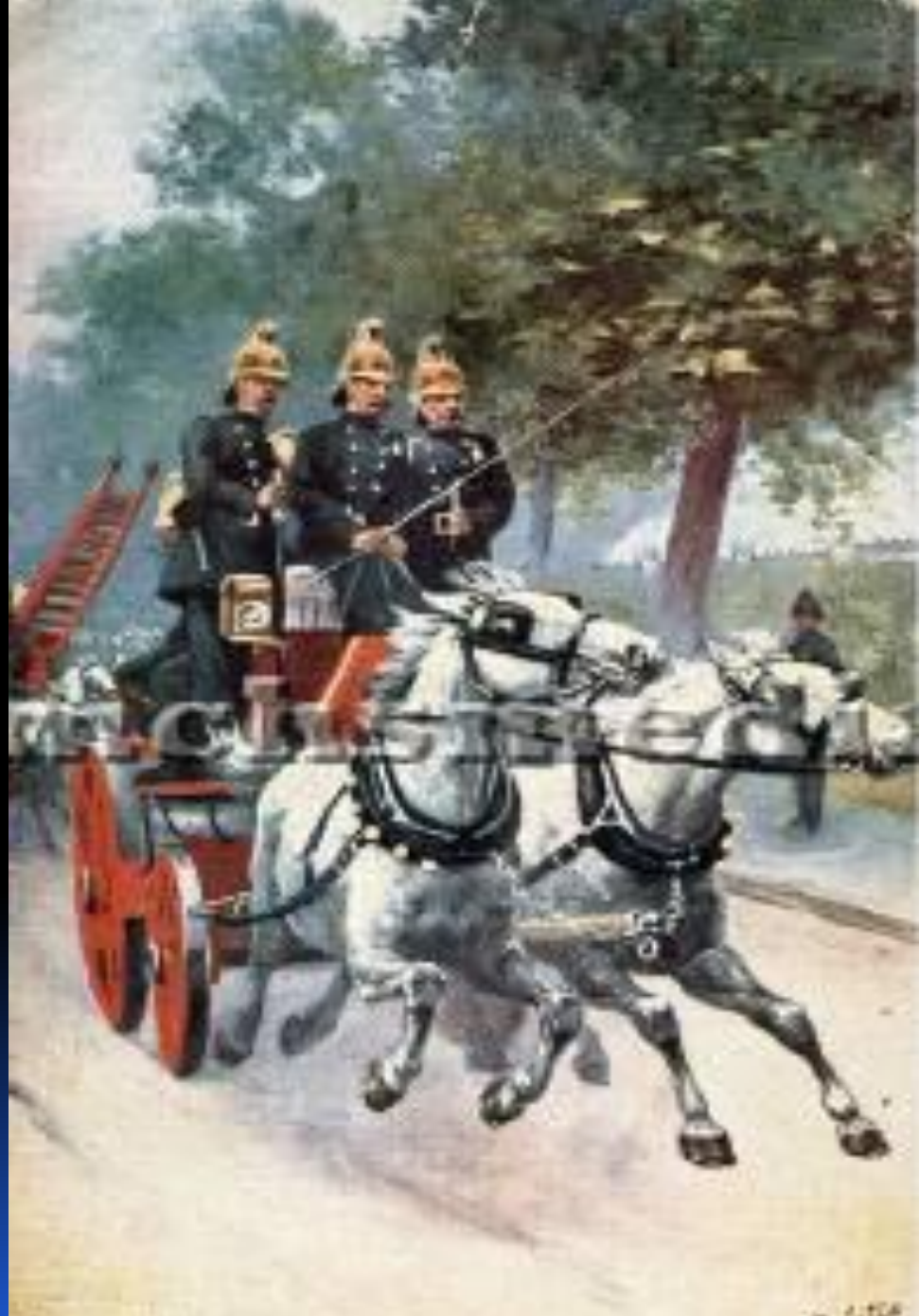
DEPT. 1811 1811