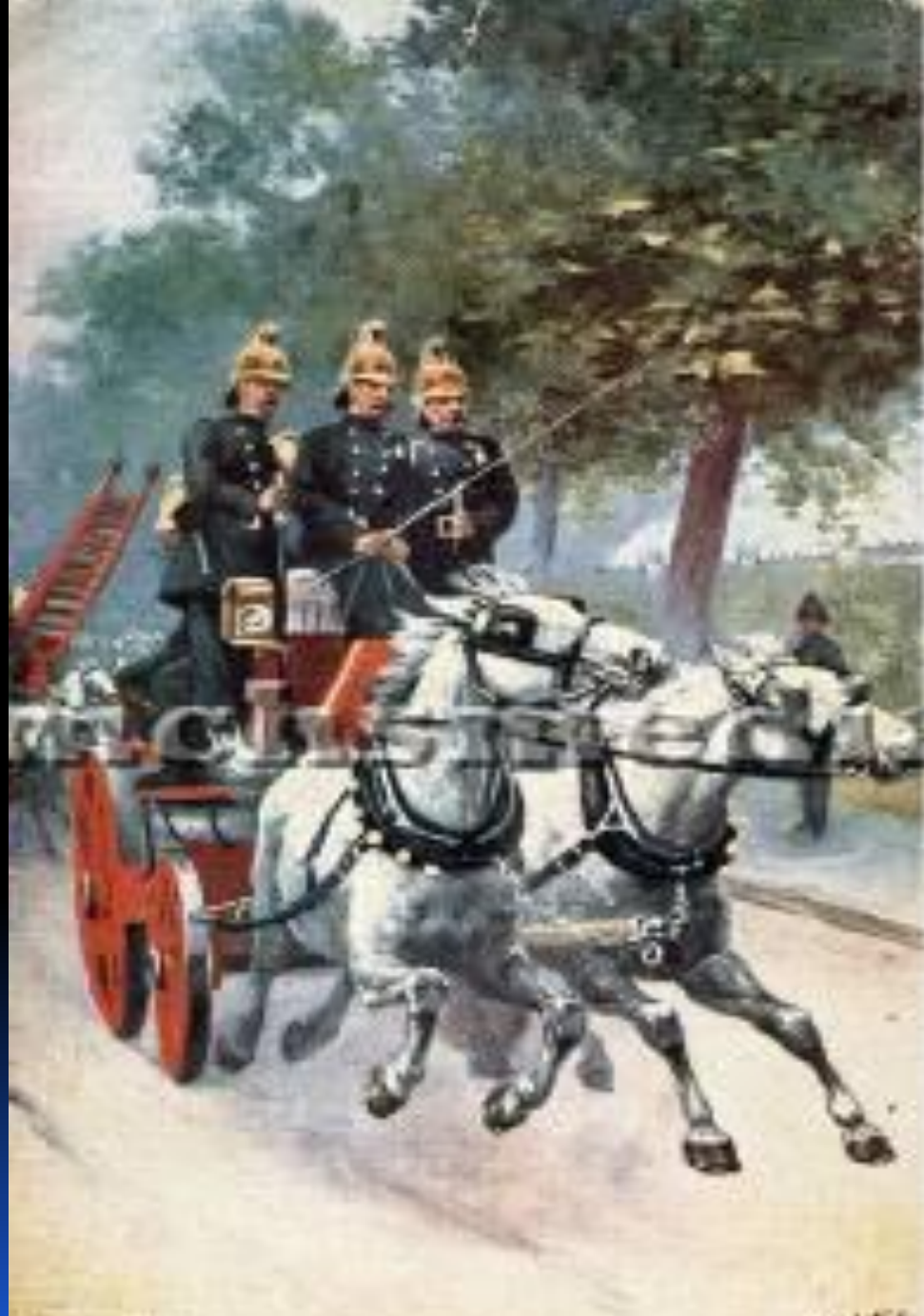
DEPT. OF THE NAVY