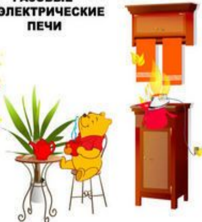
ОСТАВЛЕННЫЕ БЕЗ ПРИСМОТРА ЭЛЕКТРОПРИБОРЫ