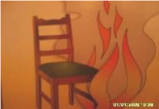
Потрескивание горящих предметов