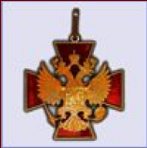
орден "За заслуги перед Отечеством"

Пожарное дело- для крепких парней, Пожарное дело- спасение людей, Пожарное дело-отвага и честь, Пожарное дело- так было и есть!