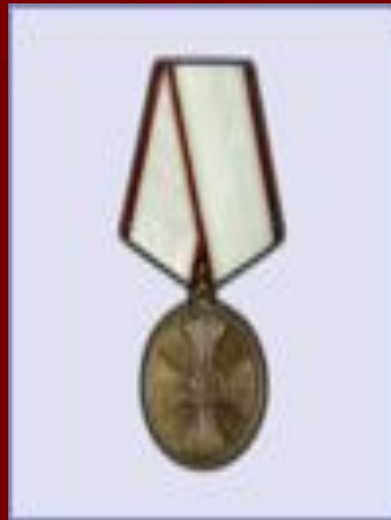
медаль "За спасение погибших"