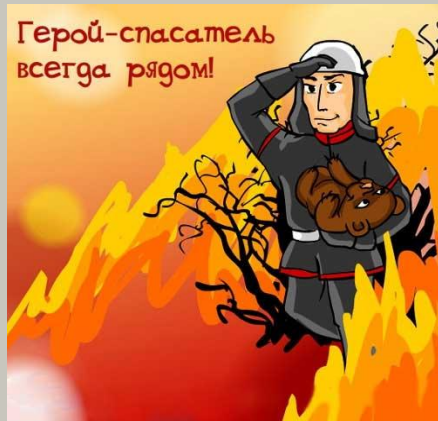
Герой-спасатель всегда рядом!