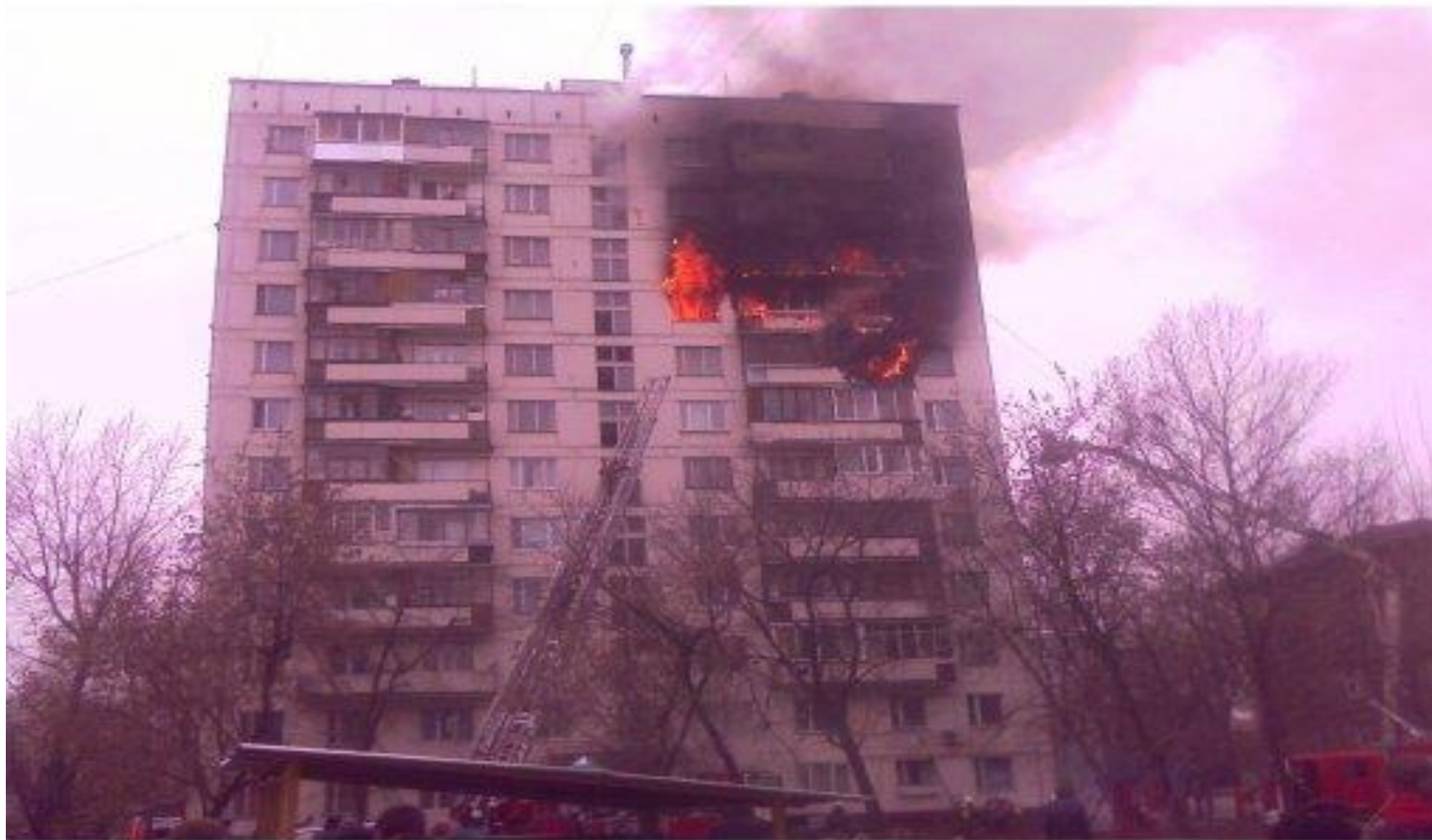
Пожар в многоквартирном доме