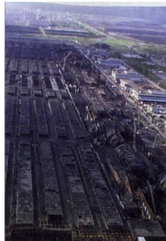
Последствия пожара на заводе двигателей АО «КамАЗ»