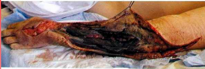
Рис. 4. Тот же больной вид с другой стороны. В дальнейшем конечность ампутирована