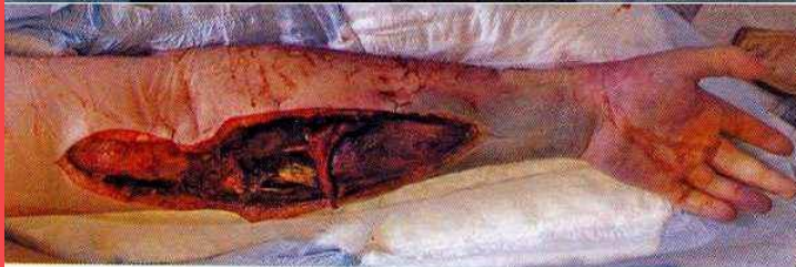
Рис. 3. Газовая гангрена левой верхней конечности после введения "Коаксила" в кубитальную вену.