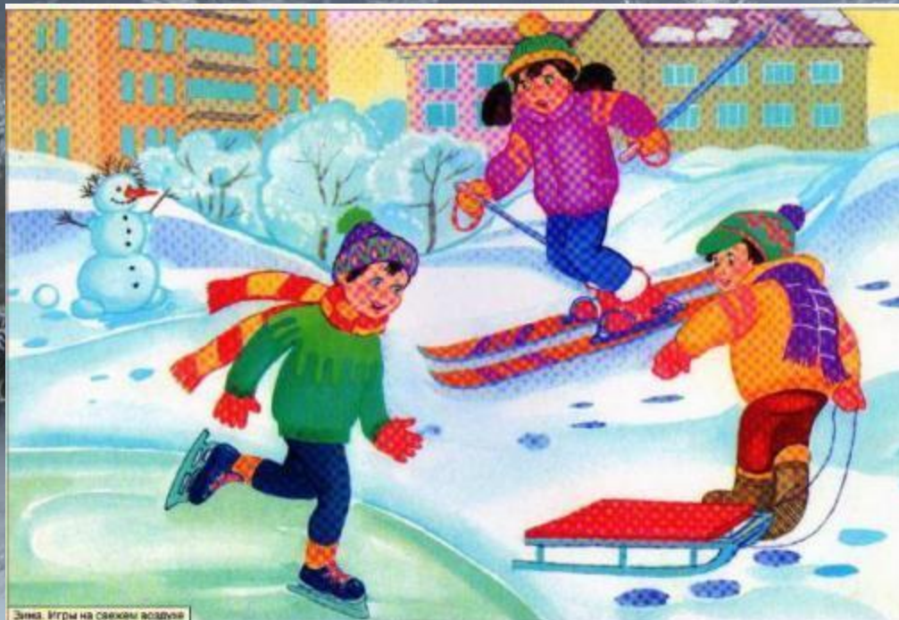
Зима. Игры на свежем воздухе