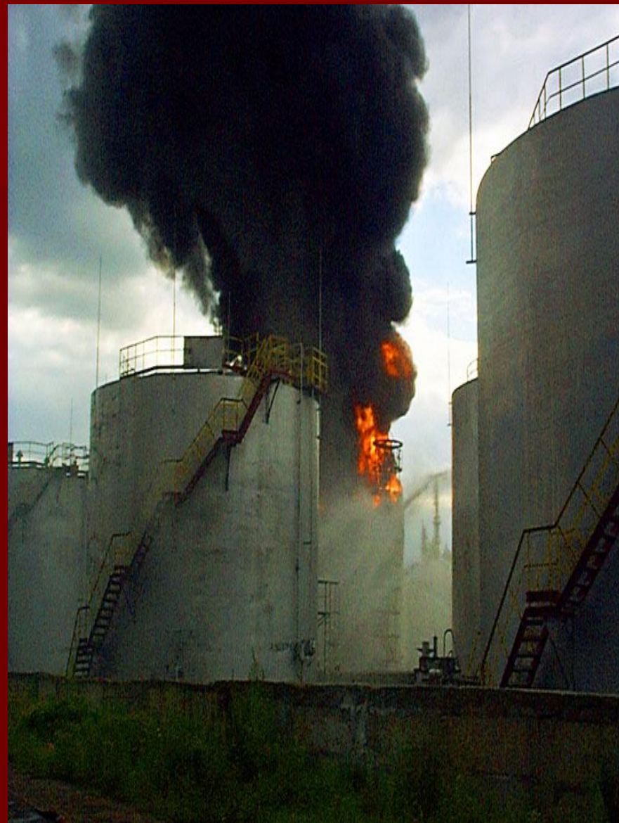
Пожары, взрывы, угрозы взрывов