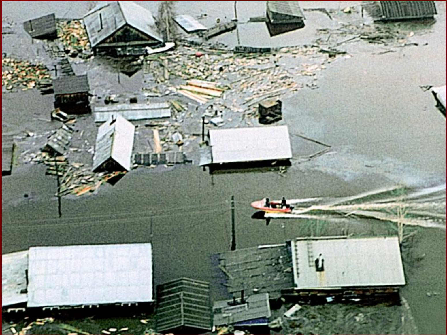
Гидродинамические аварии (прорывы плотин, дамб, шлюзов, перемычек).