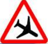
Знак 1.30 – Низколетающие самолёты