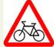
Знак 1.24 – Пересечение с велосипедной дорожкой