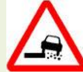
Знак 1.19 – Опасная обочина

Необходимо снизить скорость, увеличить дистанцию и боковой интервал.