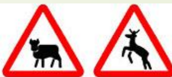
Знак 1.26 – Перегон скота. Знак 1.27 – Дикие животные