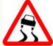
Знак 1.15 – Скользящая дорога