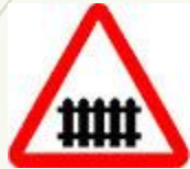
Знак 1.1 - Железнодорожный переезд со шлагбаумом