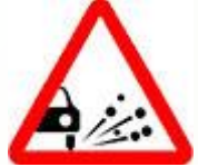
Знак 1.18 – Выброс гравия