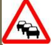
Знак 1.32 – Затор