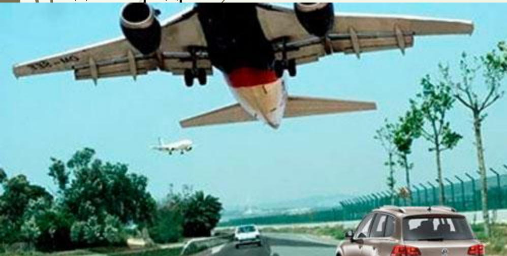
Самолеты оглушают ревом двигателя