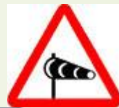
Знак 1.29 – Боковой ветер

Помните, на дороге может оказаться камень.