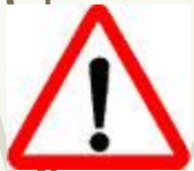
Знак 1.33 – Прочие опасности

Временный знак, означающий «глухую пробку».