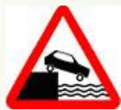
Знак 1.10 - Выезд на набережную