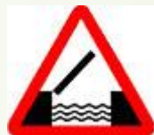
Знак 1.9 - Разводной мост