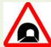
Знак 1.31 – Тоннель