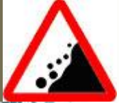
Знак 1.28 – Падение камней