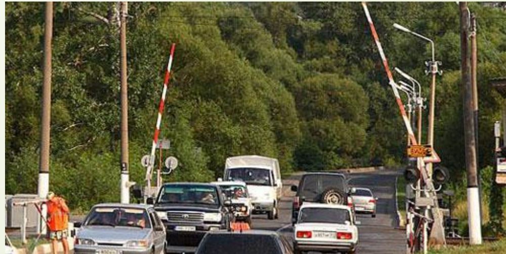
Железнодорожный переезд со шлагбаумом