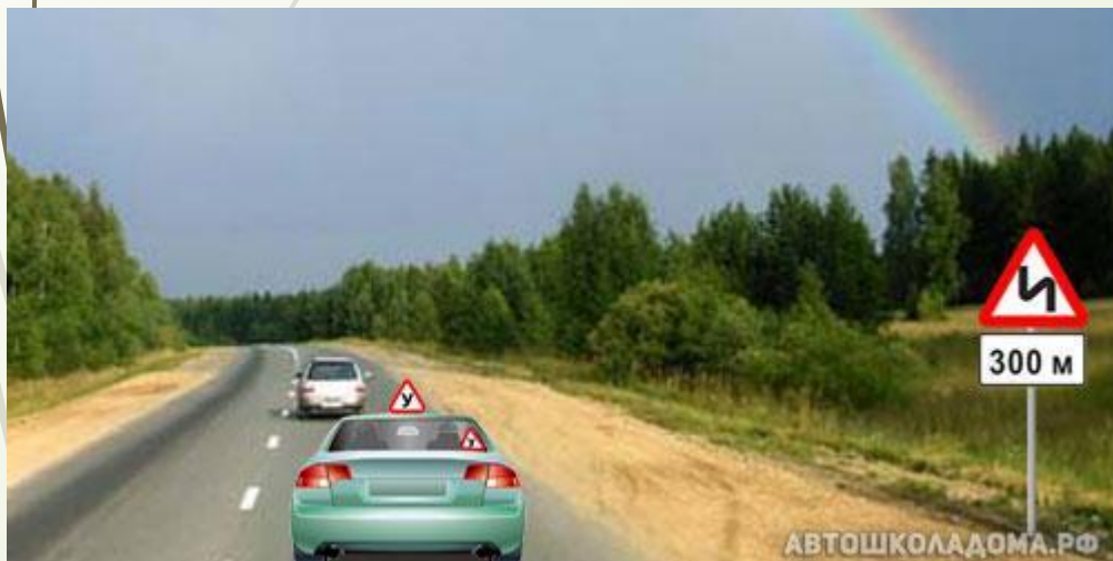
Табличка 8.1.1 «Расстояние до объекта»

Первый знак устанавливают на участке дороги, где первый поворот правый, второй – левый.