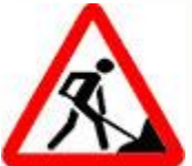
Знак 1.25 – Дорожные работы