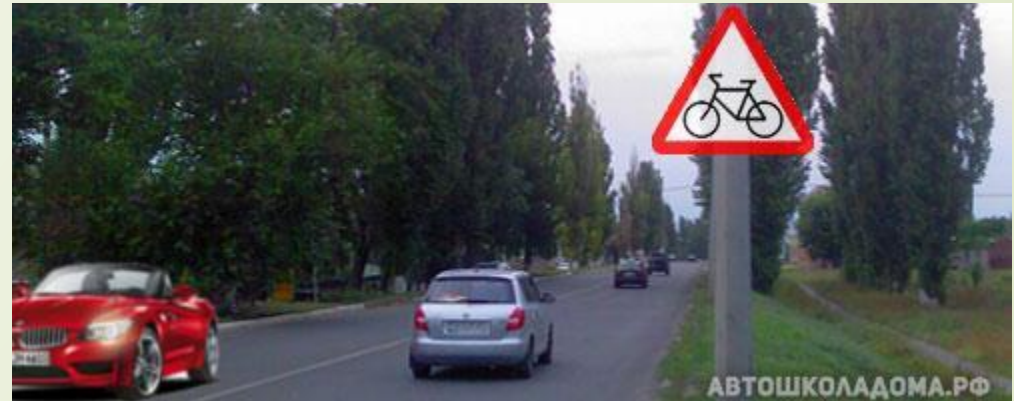
Пересечение с велосипедной дорожкой