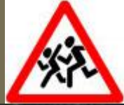
Знак 1.23 – Дети