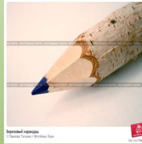
Березовый карандаш