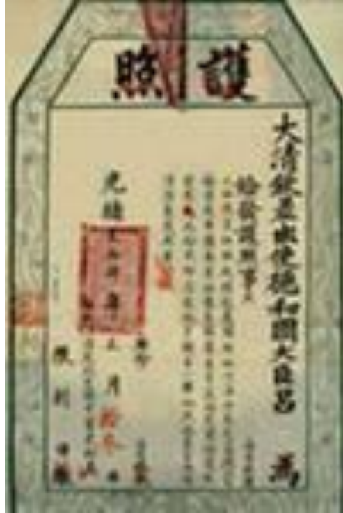
Китайский паспорт династии Цинь 1898 г