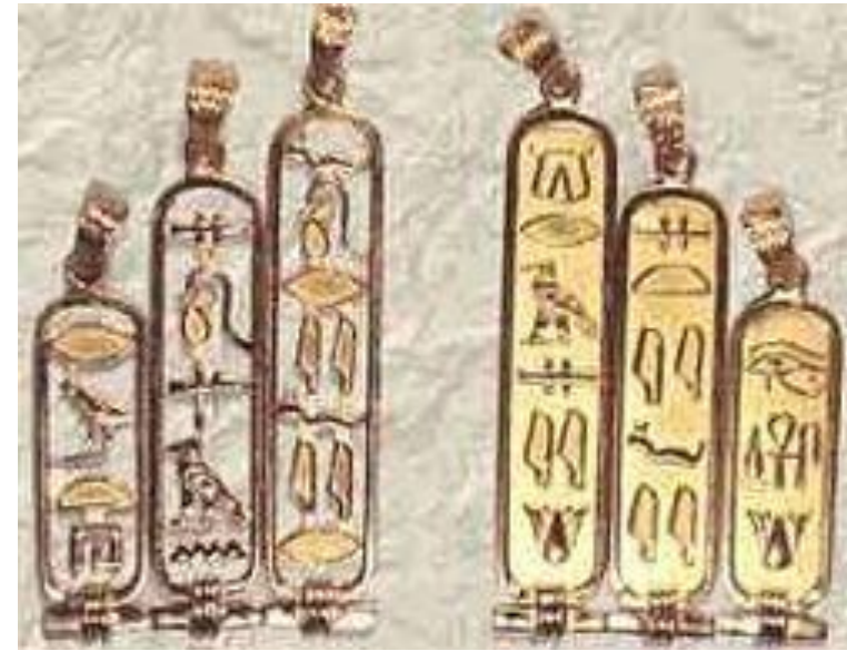
Картуш – паспорт древних владык в Египте