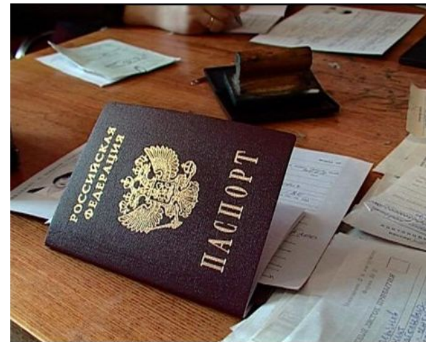
Право и правопорядок