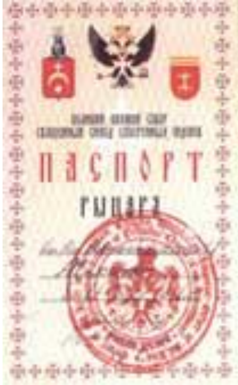
Старинный Мальтиский паспорт