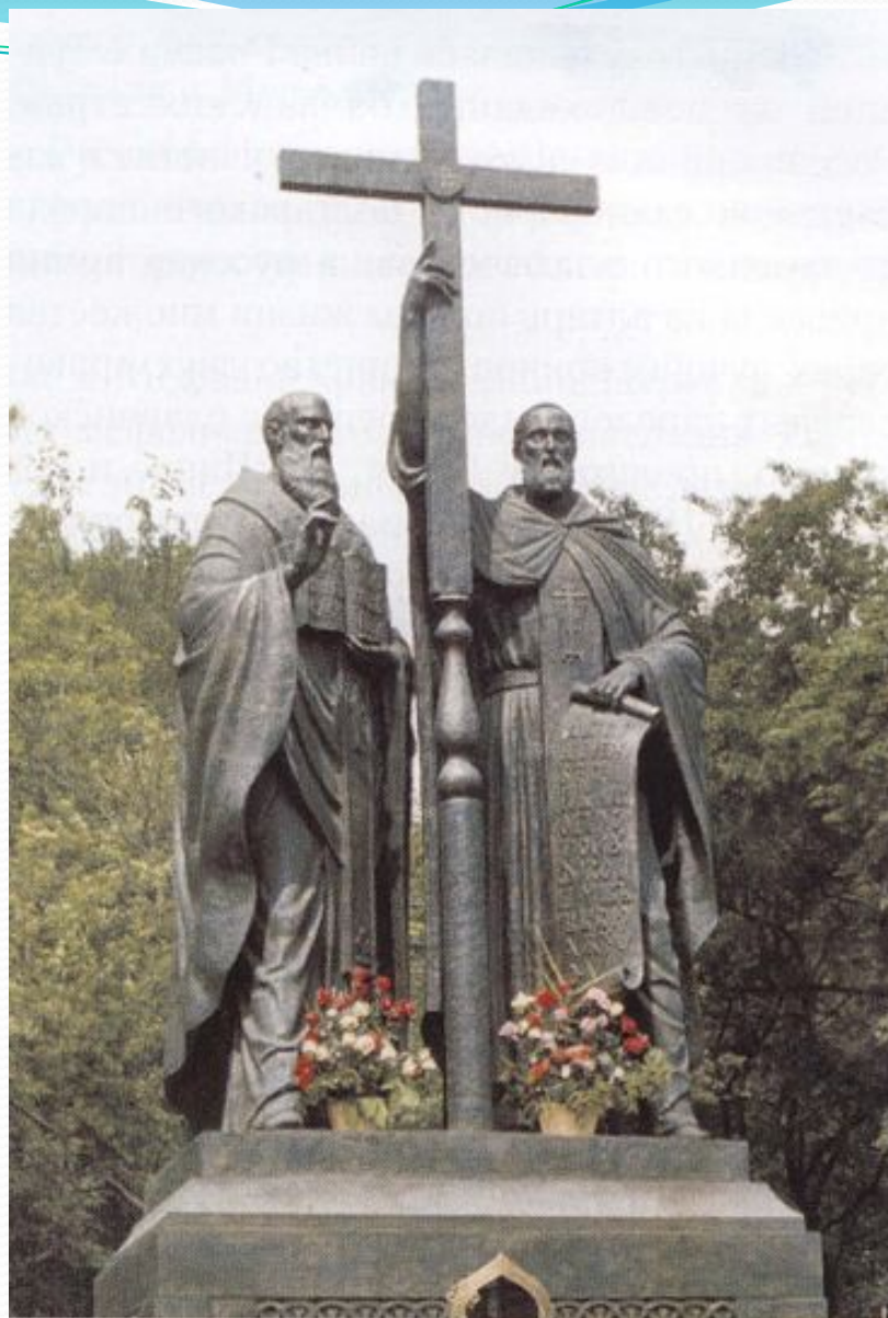
Памятник святым Кириллу и Мефодию. Скульптор В.М. Клыков. 1992 г. Москва

Начиная с 1992 года празднование Дня славянской письменности и культуры в нашей стране приобретает государственный характер. В этом году в Москве на Славянской площади был сооружен памятник святым братьям. Вот уже несколько лет 24 мая к этому памятнику направляются крестные ходы из московских храмов, а Святейший Патриарх Московский и всея Руси Алексей II совершает праздничный молебен в честь святых равноапостольных Кирилла и Мефодия.