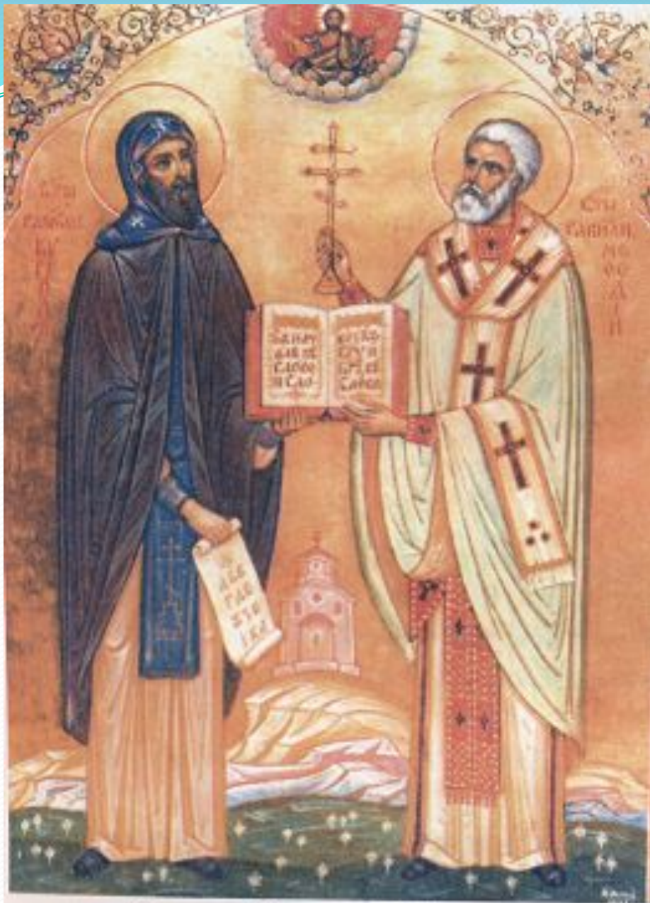
Святые Кирилл и Мефодий. Икона. 1969 г.

Если же спросить славянских грамотеев так: Кто вам письма сотворил или книги перевел, То все знают и, отвечая, говорят: Святой Константин Философ, нареченный Кириллом, — Он нам письма сотворил и книги перевел.