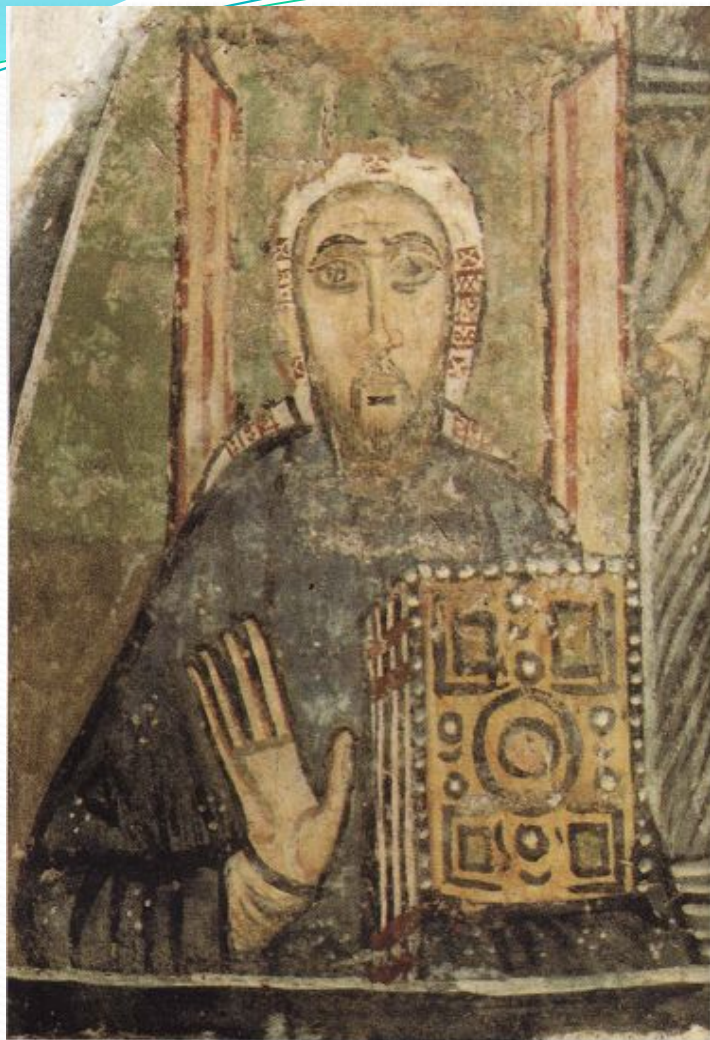
Святой Кирилл. Фреска церкви Святого Климента. IX в. Рим

Родиной братьев Константина (так звали святого Кирилла до принятия им монашества) и Мефодия была Македонская область Византии, а именно главный город области — Фессалоники, или по-славянски Солунь. Отец будущих просветителей славянских народов принадлежал к высшему слою византийского общества. Мефодий был старшим, а Константин младшим из семи его сыновей. Год рождения каждого из братьев точно неизвестен. Исследователи относят год рождения Мефодия ко второму десятилетию IX века.