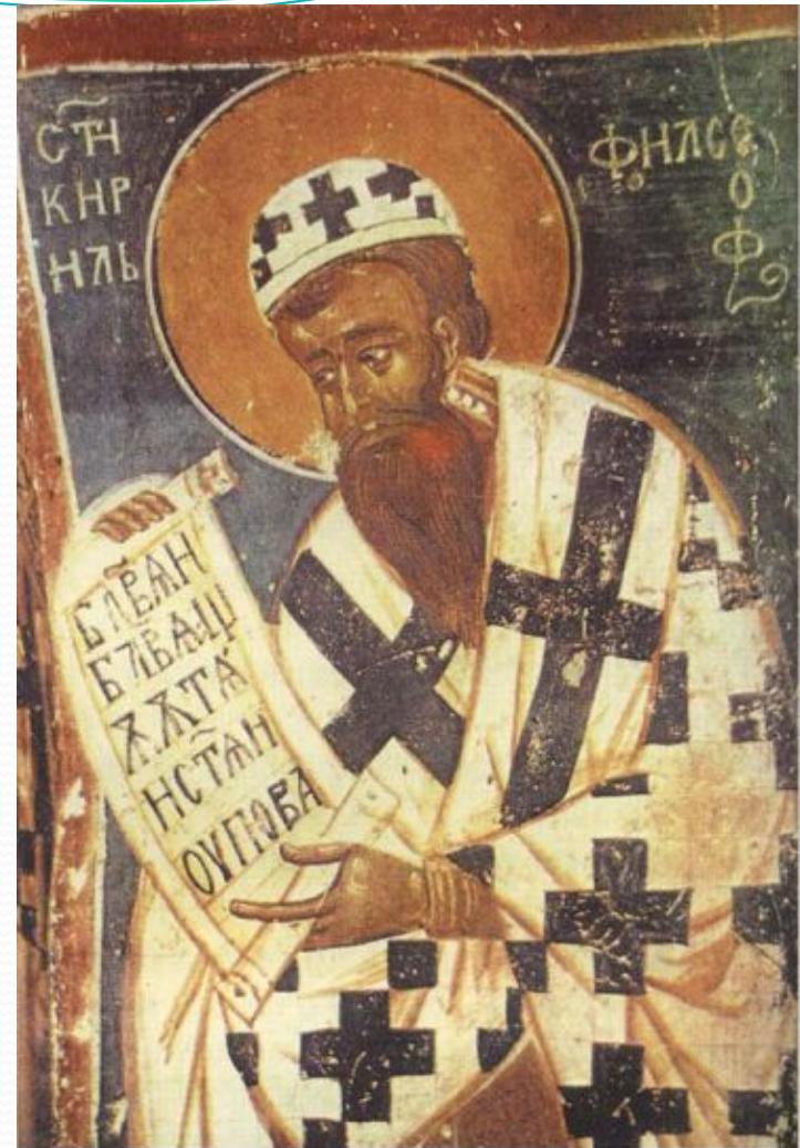
Святой Кирилл. Фреска церкви Апостола Петра. XIII в. Болгария

В Житии Константина о его образовании сообщается: «За три месяца он изучил всю грамматику и взялся за другие науки. Изучил Гомера, геометрию и у Льва и Фотия изучал диалектику и другие философские учения, кроме того — риторику, арифметику, астрономию, музыку и другие эллинские науки. И так он изучил все это, как не изучал ЭТИХ НАУК НИКТО ДРУГОЙ»