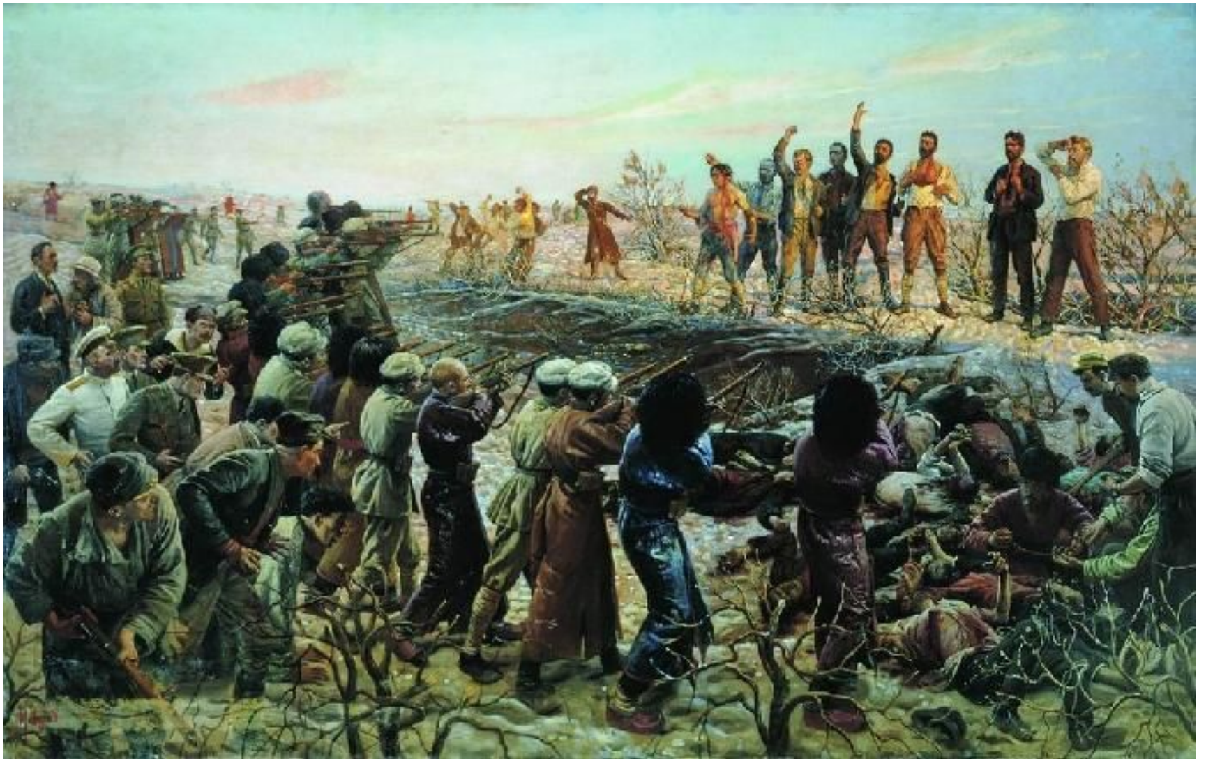
И.И.Бродский "Расстрел 26 бакинских комиссаров"